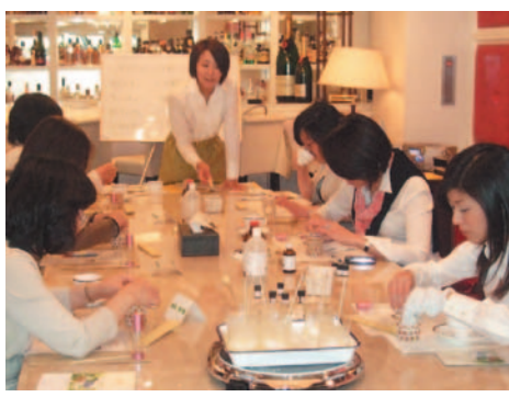
アロマセラピー講座の様子>

講師として活動するきっかけは何だったのですか？また、活動して感じてきた事を教えてください。 まずアロマセラピーとメディカルハーブの資格を取得し、教室を開きました。多くの方に美容や健康に役立つ知識を広めていきたいと思い、教える立場となりました。多くの生徒さんは、学んだ事をすぐに生活に取り入れてセルフケアを始めてくれます。年齢性別問わずに健康への関心が高まっています。 今回、快眠を誘う生活習慣病を防ぐ運動のコツというテーマで講演されましたが、どのようなポイントをお話されましたか？手ごたえはいかがでしたか？