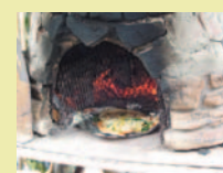
< 渡辺農園さんの釜焼きピザ >

定員:40名 先着順・11/13(金)締切 費用:大人(中学生以上) 6,000円(税込) 子ども(小学生) 4,000円(税込)