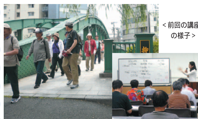
< 前回の講座の様子 >

勉強していきます。胃、肝臓、腎臓等の働きについてより詳しく理解できます。午後は、酸素をたくさん取り込んでエネルギーを生産しようという事で、散策を兼ねてウォーキングを行います。大阪の講座では、歴史を訪ねて日本三名城の一つである大阪城の周りを散策します。東京の講座では、秋葉原から日本一大きいお神輿で有名な富岡八幡宮のある門前仲町まで散策します。景色を眺めながら、またおしゃべりしながら楽しく運動する事ができます。この機会に健康に関する知識をさらに深め、ウォーキングで心も体もリフレッシュしてみませんか?